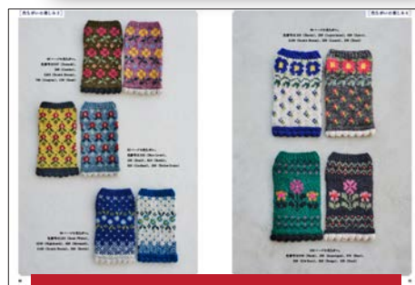
糸選びの参考になる色ちがいの作品