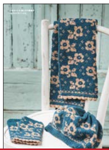
帽子とマフラーのおそろい