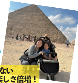
Instagramでは顔出ししていない子どもたちの素顔の表情がたくさん！楽しさ倍増！